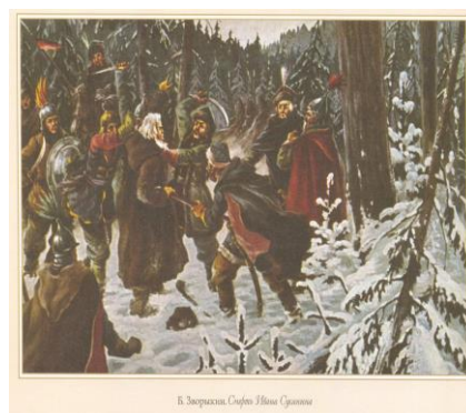
Б. Захаркин. Сцена Иван Сусанин