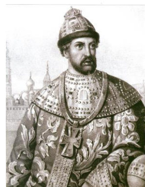
Царь Борис Годунов. Рисунок об ординском холсте из Москвы.

Ответ: после смерти Ивана IV его приемником стал сын Фёдор Иванович. Власть практически перешла к шуринам, Борисам Годуновым. В 1591 году умер младший сын Ивана IV Дмитрий. В 1598 году умер бездетный Фёдор: династия Рюриковичей прервалась. При поддержке патриарха Иова Борис Годунов на земском соборе был избран в цари.