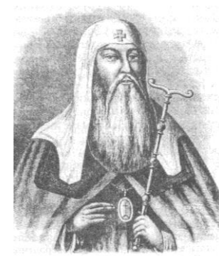
Патриарх Иов. Рисунок XIX в.

Ответ: построена крепость в Смоленске, новые города; в Москве построена колокольня Ивана Великого; учёба за границей дворянских детей Бориса Годунова; открыл царские запасы, во время голода в 1601 - 1603 году.