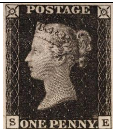
1840 г Великобритания

порядка 50 руб. В 1838 году открылась линия дилижансов от Гатчины до Царского Села. В 1841 году дилижанские линии связали столицу с Ригой и Варшавой, с 1852 года было открыто регулярное движение почтово-пассажирских дилижансов по линии Москва—Харьков. В 1840 году началось ежедневное движение пассажирских дилижансов между Москвой и Нижним Новгородом. Путь занимал 5 суток. В каретах помещалось по 8 пассажиров. Для пассажиров победнее существовали так называемые «сидейки» — нечто вроде омнибуса или линейки. Проезд на них обходился в 6 раз дешевле, чем в дилижансе. Зато и тащились они из столицы в столицу почти неделю. За 30 лет работы дилижансы перевезли больше 80 тысяч пассажиров. Но в ноябре 1851 г. открылась железнодорожная ветка Петербург—Москва. Время в дороге сократилось до 22 часов. Эпоха дилижансов отходила в прошлое. В 1880-х гг. Глеб Успенский уже с ностальгической грустью писал: «Вот-вот уже исчезнут эти чудные кони в наборной сбруе, эти бубенчики с малиновым звоном... и вместо этого будет ходить по земле какой-то коробок, вроде стряпучей печки, и без лошадей, и будет из него валить дым и свист».