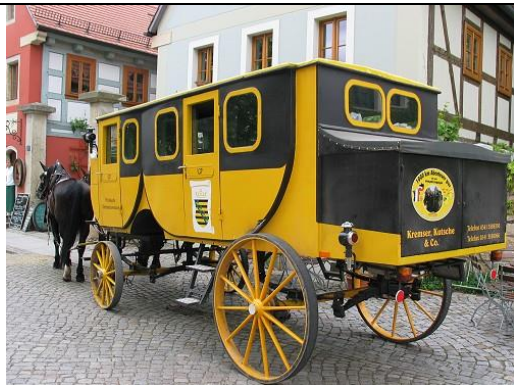
Немецкий почтовый дилижанс.

Харон. Иллюстрация Гюстава Доре к «Божественной комедии» Данте. Харон – сын Эреба и Нюкты. Эреб родился из Хаоса, брат Ночи (Нюкты), которая родила от него Гемеру (день) и Эфира(воздух). По другим авторам, от него Нюкта также родила Танатоса (Смерть), Гипноса (Сон), Немезиду (Возмездие), Керу (Насильственную смерть; иногда под именем Кер выступает несколько богинь), Мома (бога злословия), Эриду (Раздор), Гераса (Старость), Онира (Вещие и лживые сны), а также Харона, перевозчика умерших в Ад. Изображался мрачным старцем в рубище. Харон перевозит умерших по водам подземных рек, получая за это плату (навлон) в один обол (по погребальному обряду находящийся у покойников под языком). Он перевозит только тех умерших, чьи кости обрели покой в могиле. Только золотая ветвь, сорванная в роще Персефоны, открывает живому человеку путь в царство смерти. Ни при каких условиях обратно не перевозит.