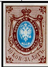
1857 г. Российская империя